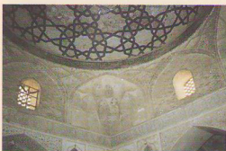
گره چینی داخل گنبد مسجد همراه با مقرنس کاری

طرح اولیه مسجد جامع مشتمل بر یک حیاط مستطیل شکل به ابعاد ۳۶ \times ۴۴ متر است که گرداگرد حیاط را شبستانهای ستوندار گلی و خشتی فرا گرفته است، شبستانهای مسجد دارای حجره های متعددی است که سقف آنها روی ستونهای بزرگ چهار ضلعی به ضخامت ۲/۲۰ \times ۱/۱۰ متر و به ارتفاع حدود سه متر استوار شده اند، طاقهای خشتی روی ستونها هلالی شکل می باشند و خشتهای به کار رفته برای ساخت چنین طاقهایی از نظر اندازه غیر معمول بوده به طوری که ابعاد آنها بالغ بر ۱۰ \times ۴۰ \times ۴۰ سانتی متر می شود.