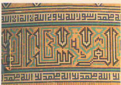
گره چینی و کاشی کاری قسمتی از گنبد مسجد

هم اکنون ورودی مسجد را یک در چوبی و شیشه های رنگی آن تشکیل می دهد ، اما در قرن هفتم هجری در ورودی و مجموعه سردر ، درست روبه روی گنبد خانه قرار داشته و مردم برای پا گذاشتن به صحن مسجد باید از یک طاق رفیع و ۲ مناره در دو طرفش ، می گذشتند . در ضلع غربی ، ایوان بزرگی دیده می شود متعلق به قرن هشتم که و طول و ارتفاع آن با یکدیگر تقریباً برابر است این ایوان با ارتفاع ۱۶/۷۰ ، طول ۱۶/۸۰ و عرض ۱۱ متر بنا گردیده و در تمام سطح دیوارها و در لبای بند آجرهای آن زینتهای گچی فراوانی به چشم می خورد که مشتمل بر کلمه الله ، محمد (ص) ، علی (ع) ، گل و برگ و نقوش هندسی است .