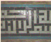
نوعی گره چینی روی کاشیکاری باخط کوفی

بیرون از محوطه مسجد در گوشه شمال شرقی مناره آجری دیده می شود که از دوره سلجوقی است و از نظر پاره ای تزئینات ظریف آجری شبیه به مناره مسجد جامع سمنان است. این مناره تا بلندی حدود ۴ متر توپر ساخته شده است، اما از این ارتفاع به بالا توخالی بوده و دارای یک راه پله پیچدار است که به انتهای مناره ختم می شود، ارتفاع مناره به ۳۰/۱۵ متر می رسد.